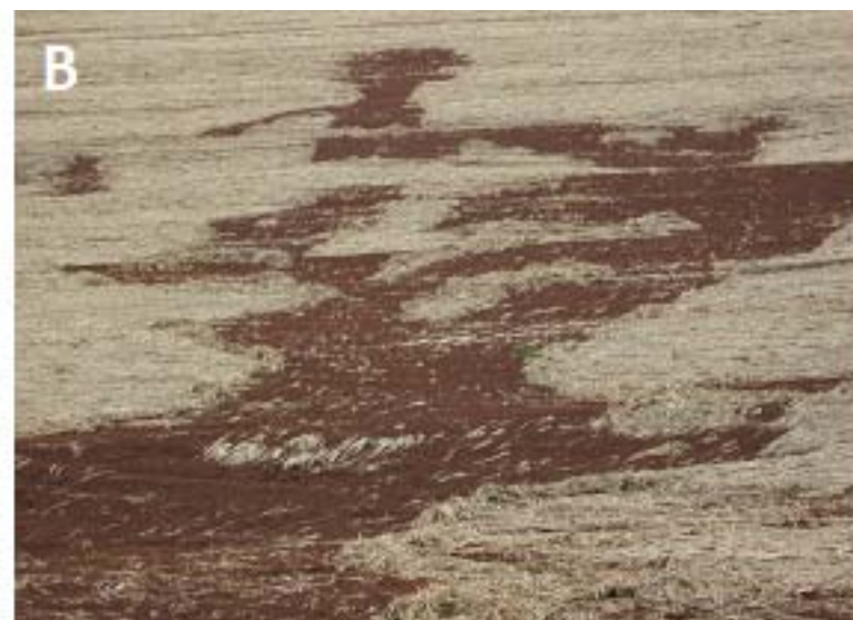
Figura 1. Imagem de uma área com Plantio Direto e práticas conservacionistas (A) e sem práticas conservacionistas e erosão de solo (B).

gota da chuva ocorre o salpicamento da superfície do solo desagregando o mesmo. Assim, pequenas partículas de solo são carregadas verticalmente no solo levando ao entupimento da sua porosidade causando o que podemos chamar de selamento superficial, fazendo com que a água da chuva não infiltre causando o escoamento, e diminuindo a infiltração e a retenção de água no solo, e consequentemente, causando a erosão do solo.