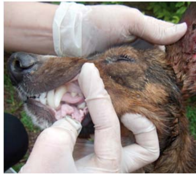
Presença de carrapato em cão, aliado à mucosa hipocorada.

te. O diagnóstico é feito através da identificação de parasitas em esfregaços sanguíneos e alterações no hemograma, evidenciando anemia regenerativa, trombocitopenia e elevado número de reticulócitos. Além disso, podem ser realizados testes mais sensíveis e específicos, como imunofluorescência indireta e ELISA. Uma vez diagnosticado com babesiose, o animal passa a ser portador da doença para o resto da vida, podendo reincidir com queda da imunidade.